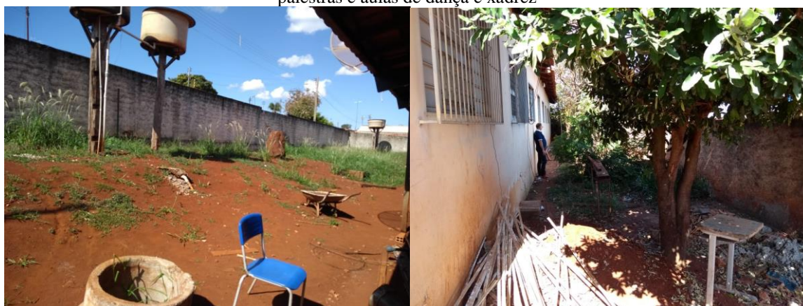
Figura 1. Escola Estadual Washington Barros França: locais onde serão implantados o Jardim da Leitura e o Laboratório de Informática e onde serão realizadas as palestras e aulas de dança e xadrez

Na Escola Estadual Washington Barros França, localizada no Setor Jacutinga, 900 crianças e adolescentes estão matriculados no Ensino Fundamental (6º a 9º ano) e Ensino Médio. A instituição atende, principalmente, o Setor Jacutinga e os setores Cidade Jardim I e II – os três bairros são resultados de estabelecimento de moradia popular dos governos municipal e federal -, considerados os bairros de renda mais baixa de Jataí. A escola, atualmente, está funcionando com a maior parte das salas de aula de placa de concreto e salas em containers , sem locais para realização de atividades esportivas, lazer e descanso. Nesse sentido, o PIS tem com uma das atividades a intervenção para a melhora desses ambientes. As imagens a seguir, da Figura 1, retratam a Escola Estadual Washington Barros França.