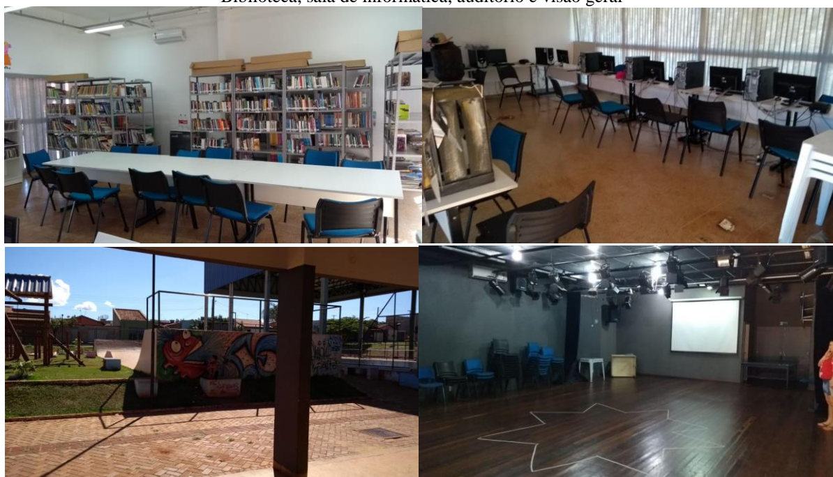
Figura 3. Praça Céu: Biblioteca, sala de informática, auditório e visão geral

Nesse contexto, a importância do Projeto de Inclusão e Socialização de Crianças e Adolescentes de Jataí se deve à vulnerabilidade social em que tal público se encontra e à capacidade transformadora da proposta do projeto.